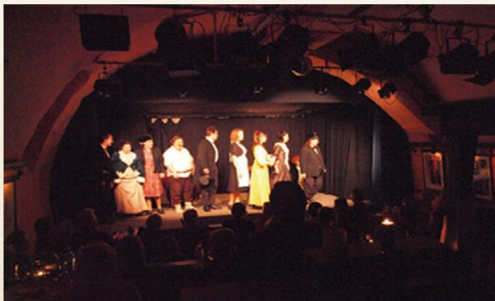
Klein aber fein: Der gemütliche, stilvolle Gewölbekeller des PIPAPo kellerTheaters mit seinem einmaligen Ambiente.

Wir freuen uns über Ihren Besuch und wünschen zu allen Veranstaltungen gute Unterhaltung.